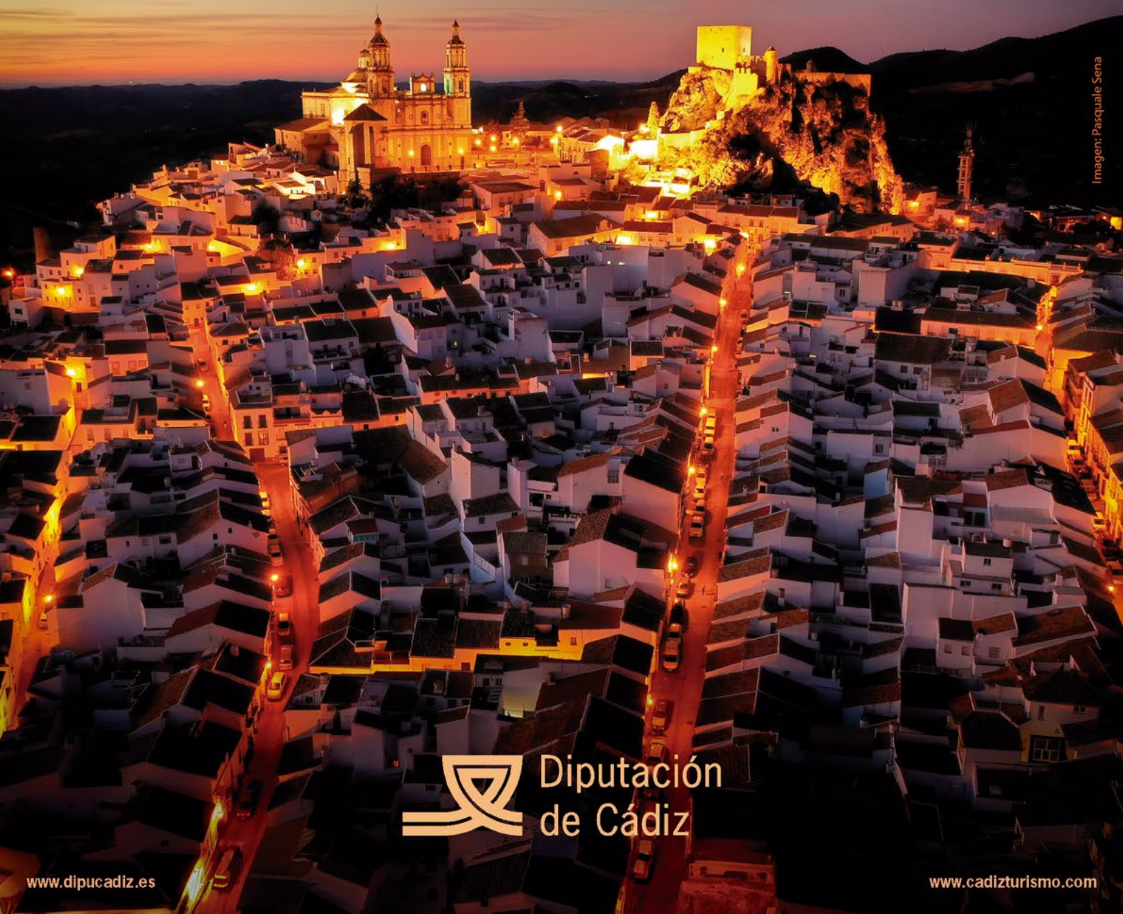
Imagen: Pasquale Sena