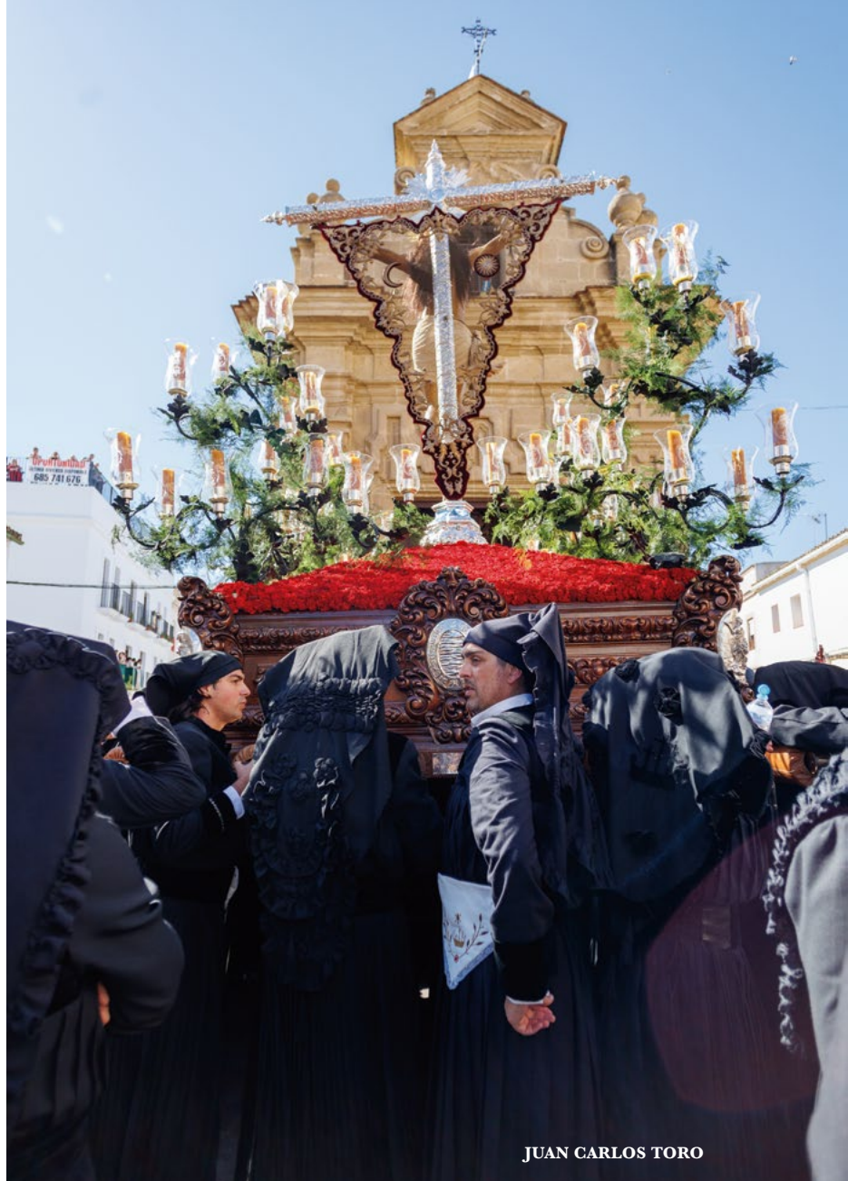
JUAN CARLOS TORO

El Cristo. Sin más. Dos palabras para identificar a este icono devocional de la Semana Santa local y que da 'jondura' flamenca y añeja al Viernes Santo. En su diseño presenta las dos caras cofradieras de Jerez, la forma sevillana en sus nazarenos de capa, en su palio y en el cortejo. Y la rancia que pervive en El Cristo y San Juan, en sus pasos y en sus cargadores. El crucificado es obra de Vasallo, San Juan es anónimo del XIX y la Virgen del Valle, coronada canónicamente en 2008, es del XVII. La hermandad data de 1575 con origen en la Cofradía de Barqueros, de ahí que en su escudo figure una barca y su ermita esté dedicada a San Telmo, patrón de los marineros. El primero es de Lutgardo Pinto con unos singulares candelabros. La cruz de plata con la vela que ampara al Cristo, dicen mucho de la identidad de la corporación. El palio es bordado por Carrasquilla en su totalidad. Su color dio pie a Antonio Gallardo para llamarla 'la flamenca de manto rojo'. La orfebrería es de Villarreal, Borrero y Fernández. El paso de San Juan es de Guzmán Bejarano. Singular es la corona, realizada en oro por su coronación.