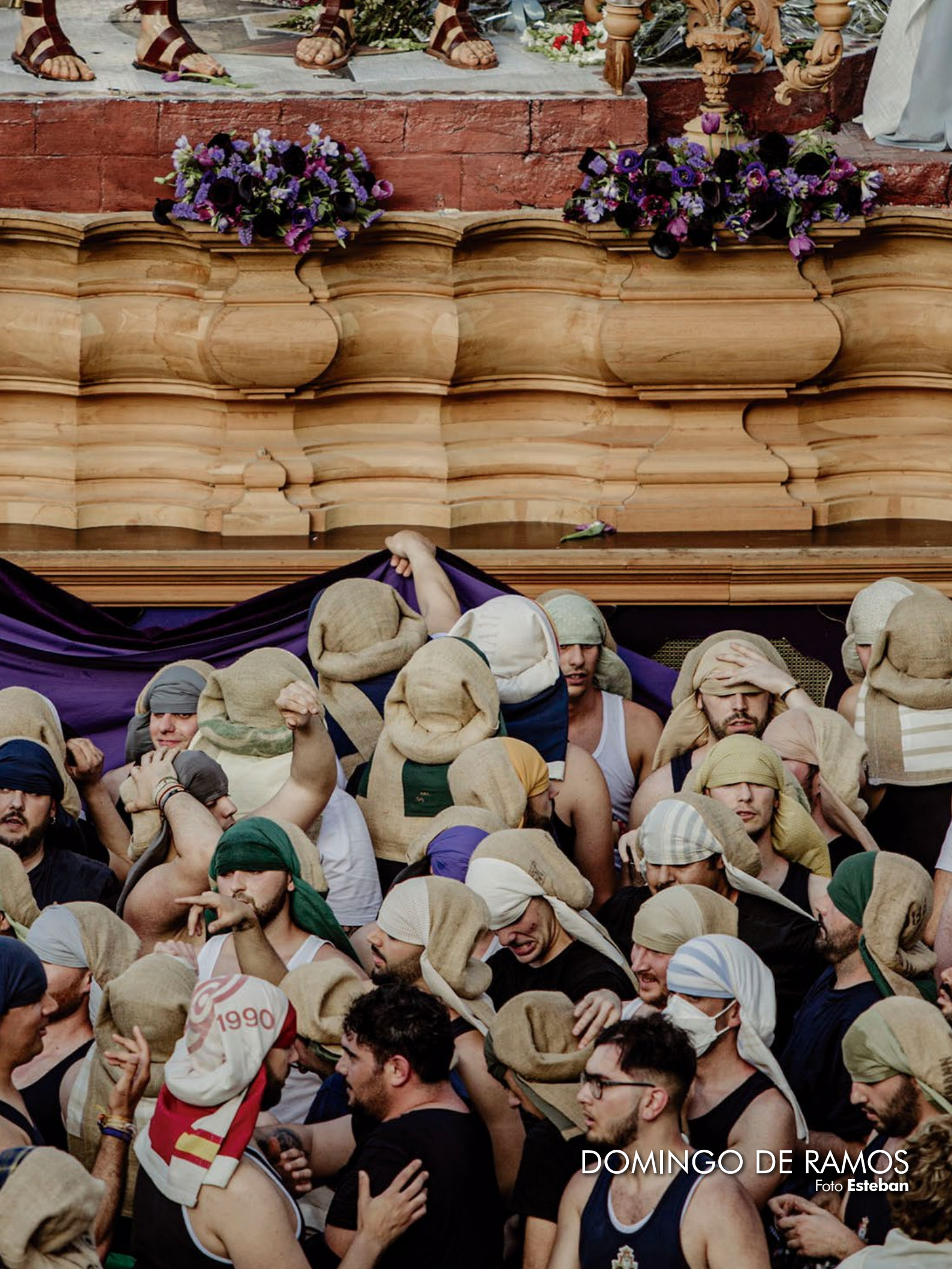
DOMINGO DE RAMOS